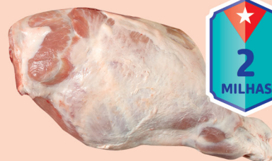
Perna de Porco c/Osso