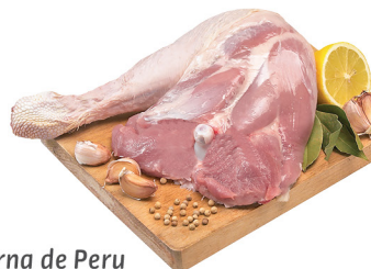
Perna de Peru Importada