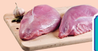
Peito de Peru Importado