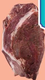
Presa de Porco Preto c/Cachaço