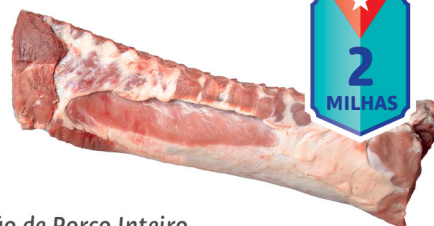
Vão de Porco Inteiro p/Costeletas