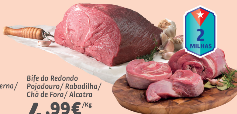
Bife do Redondo Pojadouro/ Rabadilha/ Chã de Fora/ Alcatra