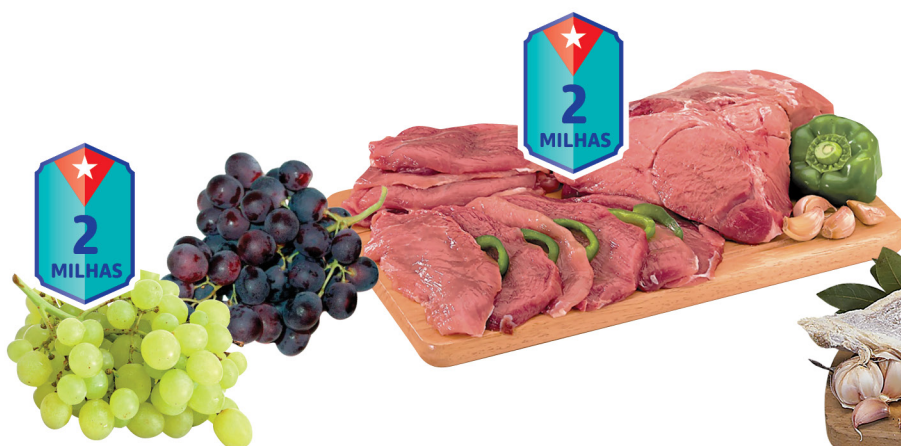
Uva Preta/ Branca